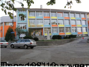
През 1994 г. детците тоеще празнуват в новопостроената сграда на улица „Велико