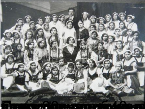
Снимка от 1946 г. Директорът на детския център в село „Велико Търново“